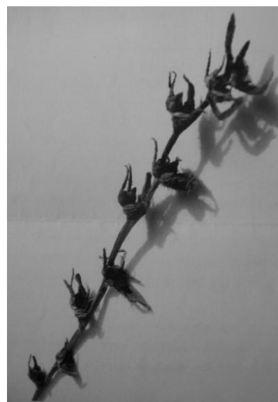
Fig. 2 – Noua specie identificată (foto inedit)

Planta a fost ierborizată în toate stadiile de dezvoltare, de la primele frunze apărute în prima jumătate a lunii martie până la căderea semințelor, la sfârșitul lunii iunie.