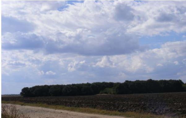
Fig 1 – Partea de nord-est a padurii Regep

Pozitiile acestor arbori le subliniez cu mai multa precizie: Oarja, Rociu, Suseni, Cimpoieri, Tutulesti, Serbanesti si in cuprinsul actualei paduri Regep (Fig. 1). Unii dintre acesti arbori (exemplu in foto din Fig.2) sunt protejati datorita zelului locuitorilor pe proprietatea carora se afla (Marin Tanase, Gheorghe Pana, etc).