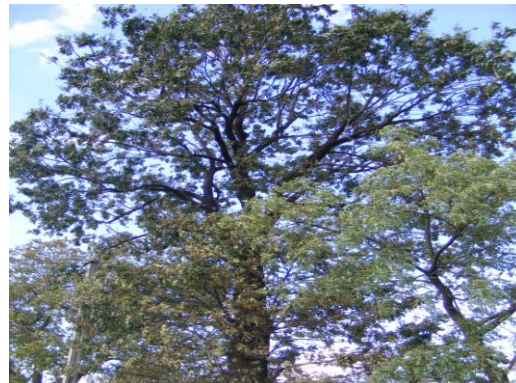
Fig. 2 – Stejar secular in comuna Suseni

A existat un astfel de arbore secular in cimitirul satului Suseni-Boieresti a carui varsta depasea doua sute de ani si alti cinci arbori a caror varsta se apropia de 400 de ani in locul numit „la Odaie”. Cei cinci arbori au fost taiati dupa colectivizare in perioada anilor 60 - 80, iar cel din cimitir pe data de 5 iunie 2009, exact de Ziua Mondiala a Mediului.